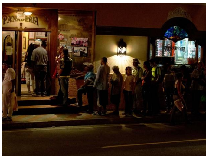
Moradores de El Hatillo, nas proximidades de Caracas, fizeram fila em uma padaria para comprar pão em dia de corte de energia.

Queda do preço do petróleo prejudicou o modelo econômico do governo.