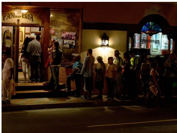
Moradores de El Hatillo, nas proximidades de Caracas, fizeram fila em uma padaria para comprar pão em dia de corte de energia.

Queda do preço do petróleo prejudicou o modelo econômico do governo.